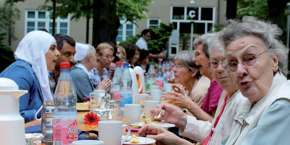
Pionierstandort Berlin Wedding

Diese Chance und gleichzeitig Herausforderung anzunehmen, sich weiter in Stadtentwicklungsprozesse aktiv einzubringen und tragfähige Konzepte vor Ort zu entwickeln ist an den Pionierstandorten gelungen. Der vorliegende Leitfaden stellt wesentliche Erkenntnisse vor und soll dazu anregen, motivieren und ermutigen, für den jeweiligen Kontext eigene Ideen zu entwickeln und sich vor Ort gemeinsam mit anderen auf den Weg zu machen.