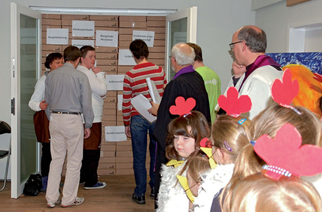
Pionierstandort Goslar: Die Wand der Benachteiligungen wird durchbrochen

Bewährte Arbeitsprinzipien, etablierte Professionalität und Strukturen sowie freiwilliges Engagement sollen für neue Zusammenhänge und Allianzen gewonnen werden. Die Pionierstandorte sind auch beispielgebend für eine neue Alltagspraxis von Religion und Spiritualität, die sich allen Bewohner/innen öffnet und auch die Rolle der Kirchengemeinde in der Bürgergemeinde stärken kann.