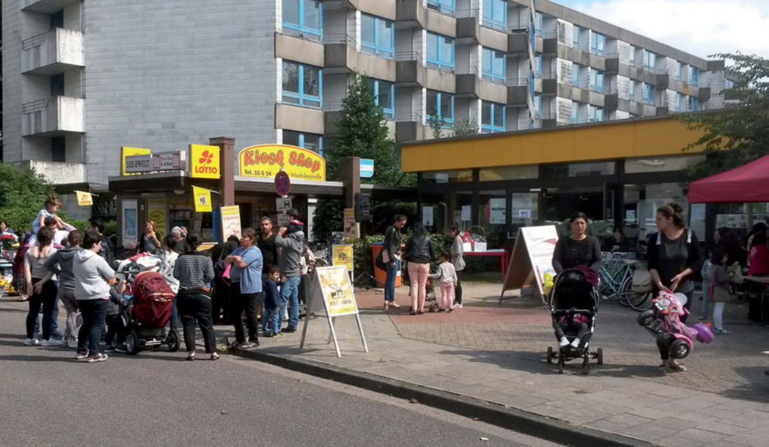
Pionierstandort Delmenhorst: Nachbarschaftszentrum Wollepark

Die Kooperation zwischen den Kirchen und ihren Verbänden sowie den Wohnungsunternehmen – insbesondere auch den kirchlichen – zeichnet sich angesichts der aktuellen Trends auf dem Wohnungsmarkt als ein wichtiges Innovationspotenzial ab, um gemeinsam mit der demografischen Entwicklung umzugehen, etwa mit neuen flexiblen generationenübergreifenden Wohnformen oder einer begleitenden Versorgung und Teilhabe von Bedarfsgruppen. Über die Schaffung von bezahlbarem Wohnraum kann ein Beitrag zur Sicherung einer sozialen Mischung in den Quartieren geleistet werden – beides flankiert von einer sozialen Quartiersarbeit.