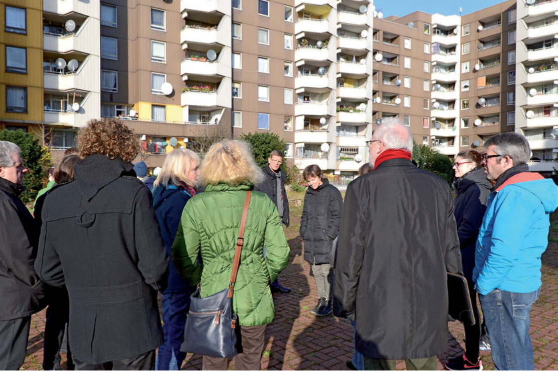
Kirche findet Stadt-Transferwerkstatt in Köln-Chorweiler, November 2015

Wenig oder nicht mehr genutzte Sakralbauten gilt es in der Regel zu bewahren, aber auch einer dauerhaften Neu- oder Nachnutzung in den Quartieren zuzuführen. Einige Ansätze sind vielversprechend und zeigen die quantitative Dimension der derzeitigen Nutzungseingpässe im kirchlichen Bereich auf, z.B. die Informations- und Beratungsplattform für Kirchenumnutzung der Landesinitiative StadtBauKultur NRW 1 , der Kirchbauverein der Moderne an Rhein und Ruhr, „Querdenker – 500 Kirchen in Thüringen“ von Ev. Kirche in Mitteldeutschland und IBA Thüringen.