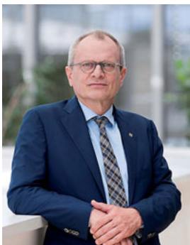
Ulrich Lilie ist Präsident der Diakonie Deutschland.

Seit 2011 besteht die Projektpartnerschaft Kirche findet Stadt zwischen dem Deutschen Caritasverband und der Diakonie Deutschland. Was als zeitlich befristetes Experiment einer ökumenischen Plattform begann, wurde zu einem Erfolgsmodell der kontinuierlichen Zusammenarbeit zwischen den beiden Verbänden. Gemeinsam wurde „der Stadt Bestes“ (Jeremia 29, 7) gesucht, um eine Verbesserung der Lebensverhältnisse für Menschen vor Ort zu erreichen. Wenn dies gelingen soll, ist es notwendig, die Menschen mit ihren Nöten und Ideen, aber auch in ihren Netzwerken und Nachbarschaften als Teil integrierter sozialer Stadtentwicklung einzubeziehen. Von Anfang an wurde daher die enge Zusammenarbeit zwischen den verbandlichen Akteuren von Diakonie und Caritas mit den Kirchengemeinden vor Ort gepflegt.