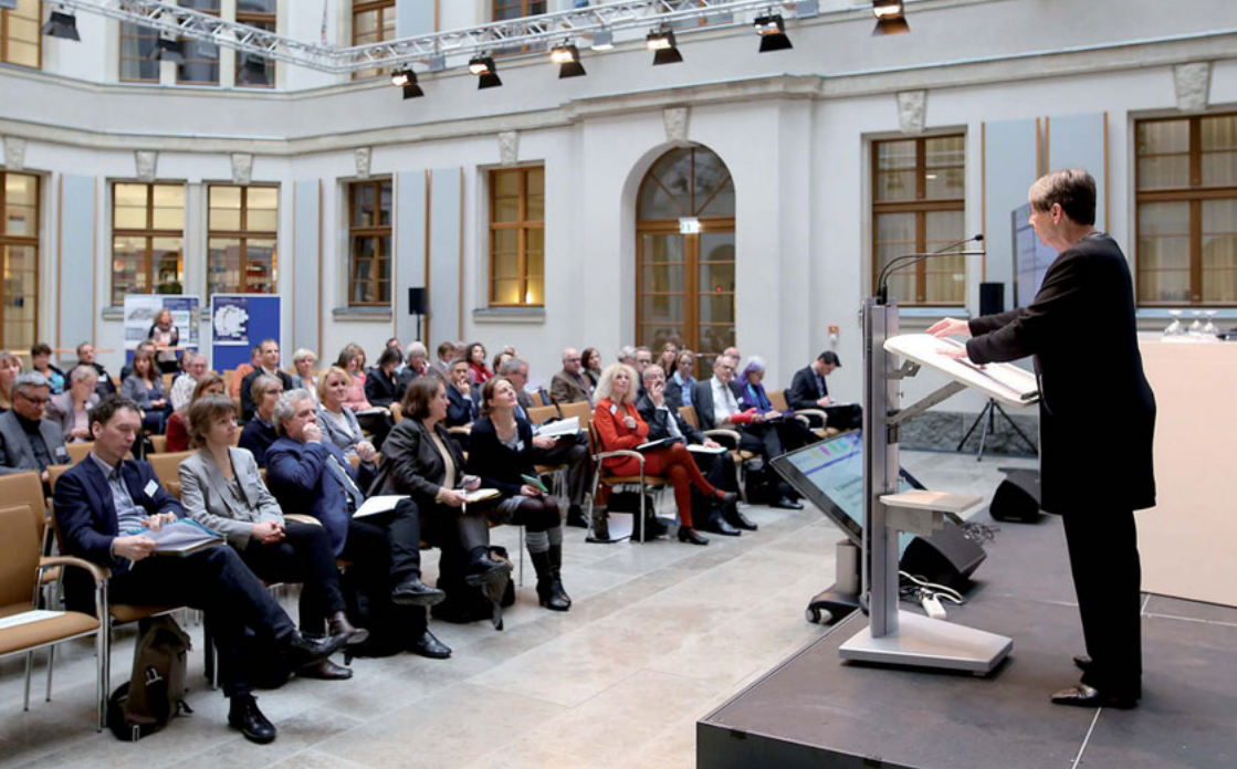
Bundesbauministerin Barbara Hendricks bei der Kirche findet Stadt -Zwischenbilanz im November 2016

binden. Voraussetzung hierfür ist es Partner/innen in den Quartieren zu finden, die dort ohnehin aktiv sind und die so mit einem hohen Maß an Engagement die Geschichte ihrer Stadt gestalten. Die Definition von Instrumenten und Maßnahmen, die konkret auf Problemlagen in Quartieren, teilweise auch mit kleinen und experimentellen Schritten reagieren, ist ein Charakteristikum einer modernen Stadtentwicklung. Das Projekt Kirche findet Stadt hat hier eine der „reichsten“ Akteurslandschaften zu Themen der Stadtentwicklung sensibilisiert und die Verbindung mit anderen Stakeholdern der Stadtentwicklungspolitik auf unterschiedlichsten Ebenen und in einer neuen Form möglich gemacht. Kirche findet Stadt ist eines der sehr wichtigen und wertvollen Projekte der Nationalen Stadtentwicklungspolitik.